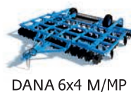
DANA 6x4 M/MP