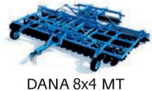
DANA 8x4 MT