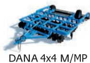
DANA 4x4 M/MP