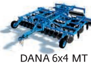
DANA 6x4 MT