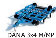
DANA 3x4 M/MP